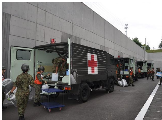
医療支援資材等積載