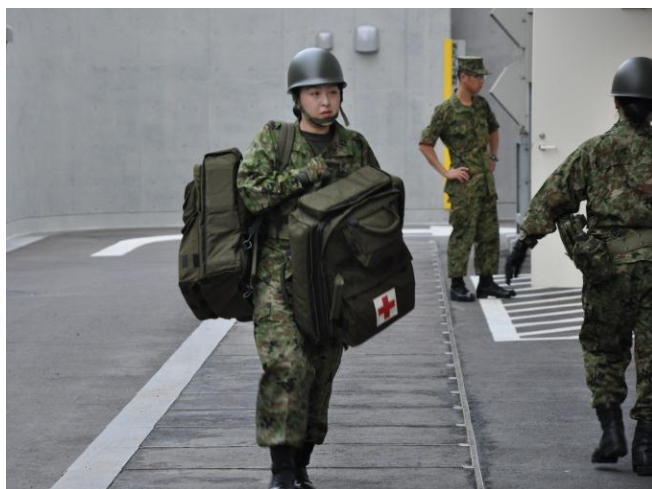
即動倉庫より資材搬出