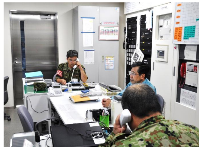
状況開始（電話呼集）

「道東地区において震度6強の地震発生」の状況付与の下、情報伝達要領及び医療支援隊派遣準備の点検を実施し、定期異動後の即応態勢の点検及び実効性の向上を図った。