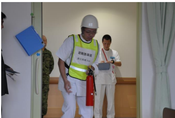
出火階病棟勤務者による初期消火