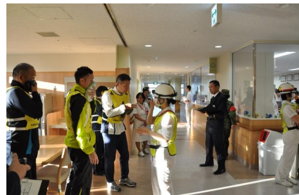
勤務員による患者の掌握