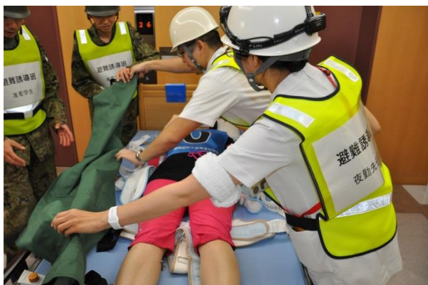
布担架を活用した患者の搬送準備