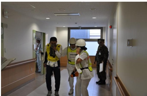
出火病室からの患者の避難と本部隊への通報

病院は、消防法施行規則に基づき札幌市消防局の指導のもと平成28年度避難訓練(検証)を実施した。夜間を想定した訓練であり、自衛消防隊長(当直司令)の指示のもと、通報連絡班、初期消火班、避難誘導班等の各班が整齊と行動し、今回の検証時間(11分)以内のところで6分で、出火区画の患者を安全区画まで安全に避難させた。