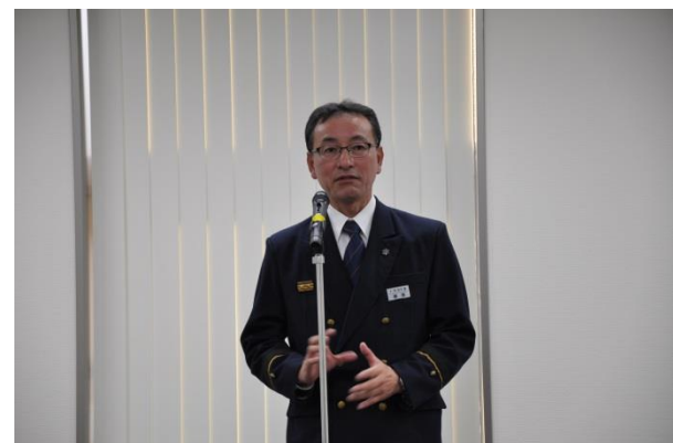
札幌市消防局南消防署 防火推進係長からの指導受け