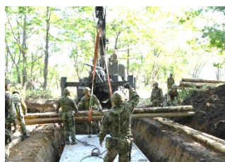
整備所の構築 (第5後方支援隊)