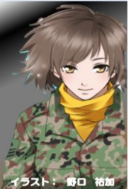
イラスト: 野口 祐加

各種イベントや部隊の紹介、過去の「ひがし北海道だより」など情報盛りだくさん! ぜひ! クリックを!!