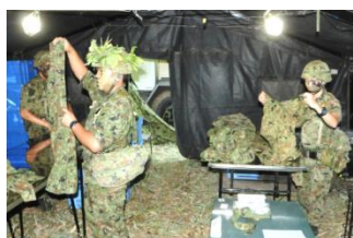
状況下における洗濯作業 (第5後方支援隊)