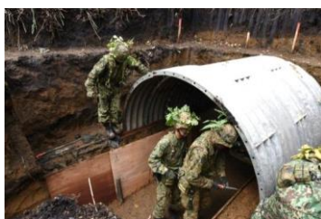
指揮所内部の構築 (第5飛行隊)