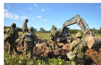
機関銃用軽掩蓋の構築 (第27普通科連隊)