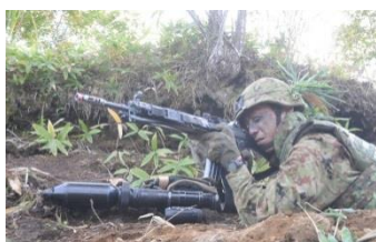
戦闘予行 (第4普通科連隊)