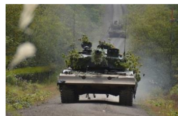
陣地へ向かう戦車 (第5戦車大隊)