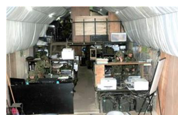
地下に構築した旅団指揮所内 (第5施設隊)