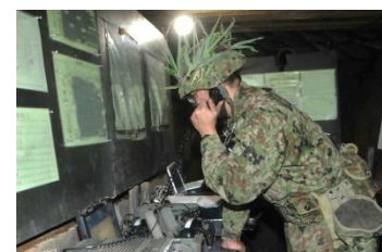
指揮所活動 (第5化学防護隊)