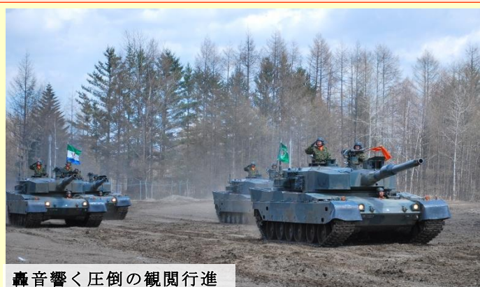
轟音響く圧倒の観閲行進

観閲行進は駐屯地各部隊が参加し、整齊と行進する隊員や車両、また各戦車中隊担当地区の町旗を掲げて行進する戦車に観客から盛大な拍手が送られました。