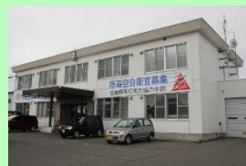
帯広市西14条南14丁目4

あらゆる機会を活用した積極的な広報施策等の推進をもって任務達成を期す所存であります。昨年度に続きましてのご支援・ご協力のほどよろしくお願いいたします。