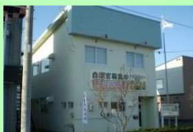
中標津町東1条南1丁目7-1