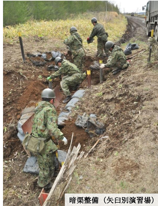
暗渠整備 (矢白別演習場)

旅団は、全整備期間を通じて部隊活動の基礎である団結・規律・士気を高めるとともに、全ての力を結集し、執念をもって与えられた任務を完遂しました。