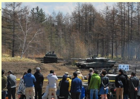
迫力ある訓練展示に釘付けとなる来場者

訓練展示では、戦車小隊による攻撃の一部が展示され、土煙をあげ突入する戦車、空包の射撃等、迫力満点の展示に観客からは歓声が上がっていました。