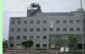
根室市弥栄町1丁目18 根室地方合同庁舎4F

最後に、募集に繋がるとと思われる情報（些細なことでも構いません。）がありましたら、根室地域事務所へお声掛けをお願いします。