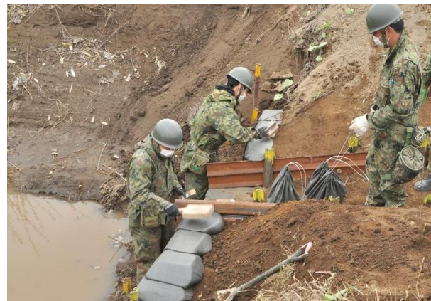
降雨による道路の損壊を防ぐための溜めます整備 (矢白別演習場)