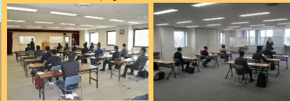
釧路試験会場 (道東経済センタービル)

帯広地本は、一人でも多くの志願者が難関を突破することを期待するとともに、これから実施される各種試験に向けて更なる募集活動を実施していきます。