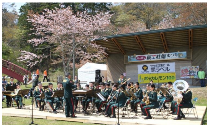
綺麗に咲いた桜の木を背に演奏する音楽隊

予定していた曲が終わると、クオリティの高い音楽隊の演奏に会場からはアンコールを求める拍手が鳴り響き、「サンバ・テンペラード」を演奏してステージの幕を閉じました。