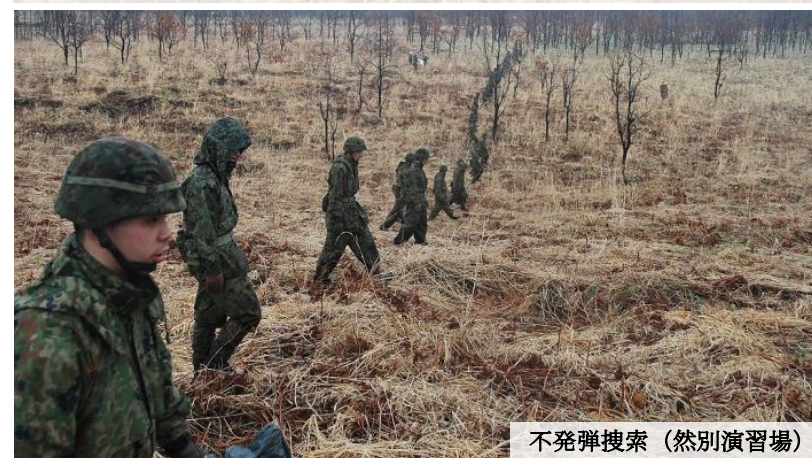
不発弾捜索 (然別演習場)