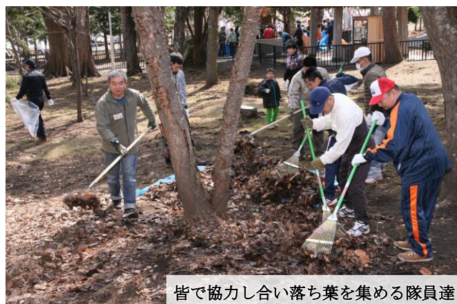
皆で協力し合い落ち葉を集める隊員達

約2時間の清掃で境内は見違える様に綺麗になり、最後は、皆で美幌神社を参拝してボランティア活動を終了しました。