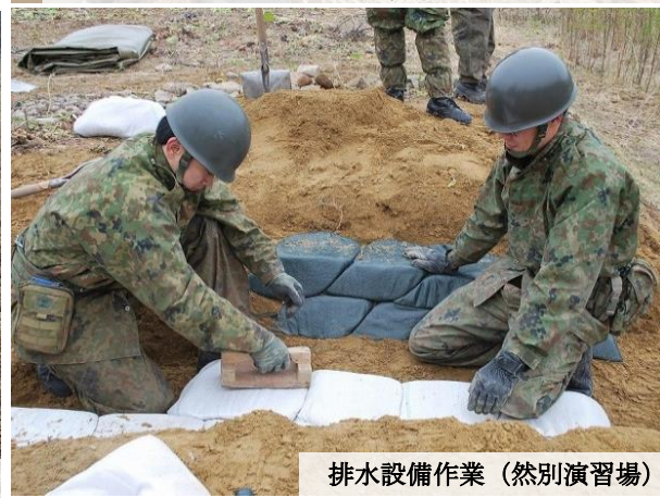
排水設備作業 (然別演習場)