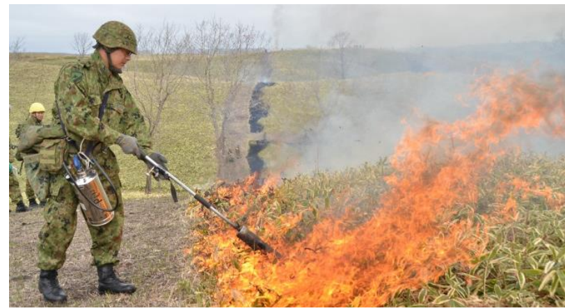
弾着区域における火災発生を防止するための野焼き作業 (矢白別演習場)