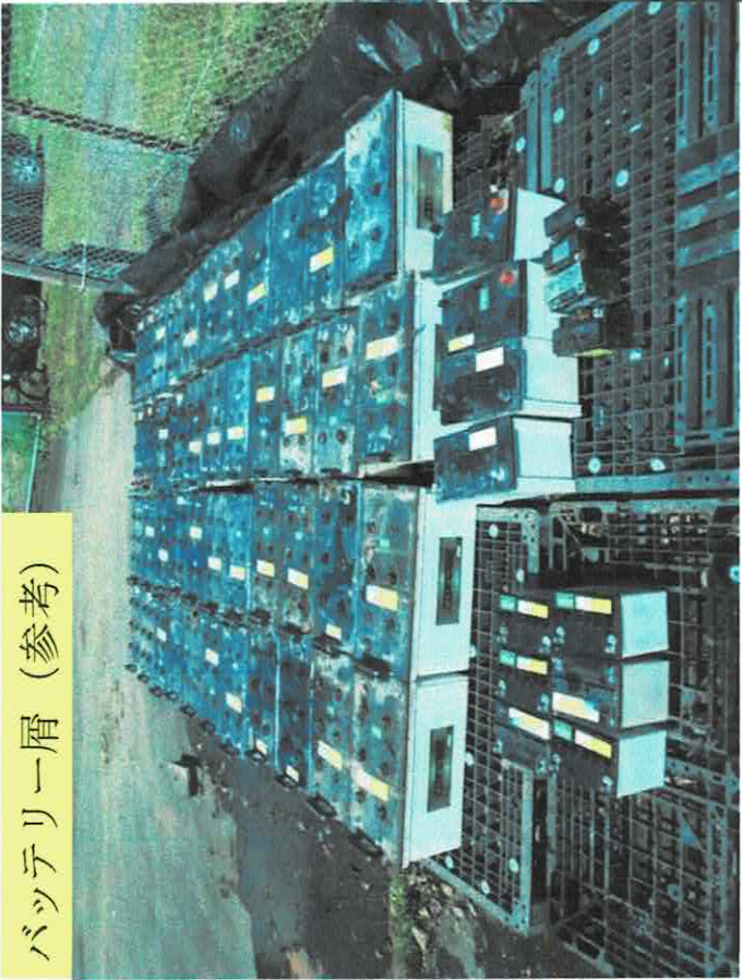
バッテリー一層 (参考)