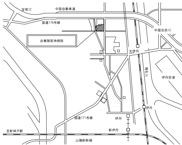
川西駐屯地 案内図 S=1:40,000