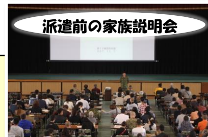
派遣前の家族説明会