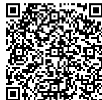
ご家族へのお知らせ

※ファイルの閲覧には パスワードが必要です 『KIZUNA2017』 (半角、大文字)