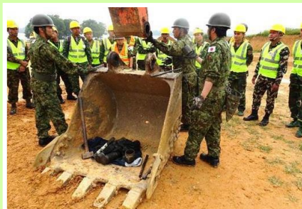
ベトナムでの教育

自衛隊は、国際平和のための努力及び国際協力の推進に寄与するため、世界各地における国際平和協力業務、大規模な災害に際しての国際緊急援助活動に対し、主体的・積極的に取り組んでいます。