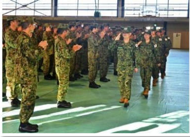
部隊での壮行行事