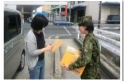
派遣隊員への追送品