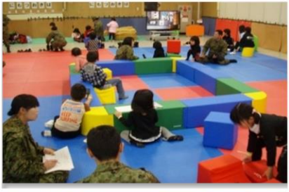
緊急登庁支援施設の開設

災害派遣時には、緊急登庁支援として 緊急登庁支援施設の開設 、ご家族へ 派遣活動の説明会 や 派遣活動便りの配布 を行います。また、現地で活動する派遣隊員へ 追送品の発送 を行います。