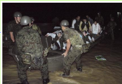
ボートによる人命救助