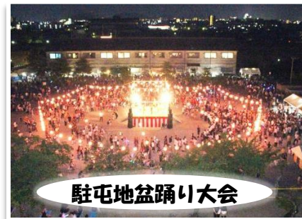
駐屯地盆踊り大会