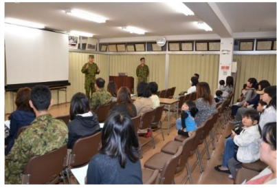
派遣活動の家族説明会