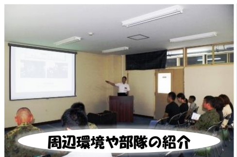
周辺環境や部隊の紹介

ご家族の新たな生活環境への変化に伴う不安を取り除いて、少しでも安心して生活をしていただくため、隊員とご家族に自衛隊や部隊に関することについて説明するとともに、部隊長やメンタルヘルスの専門家による講話などを実施しています。