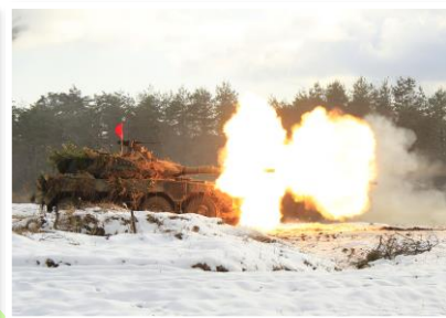
戦車の実弾射撃訓練