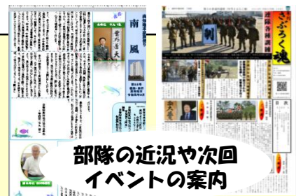
部隊の近況や次回イベントの案内