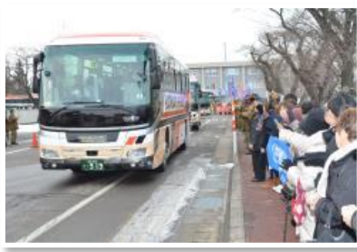
駐屯地での見送り