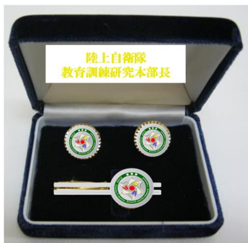
図2 - ケース内の配置・印字