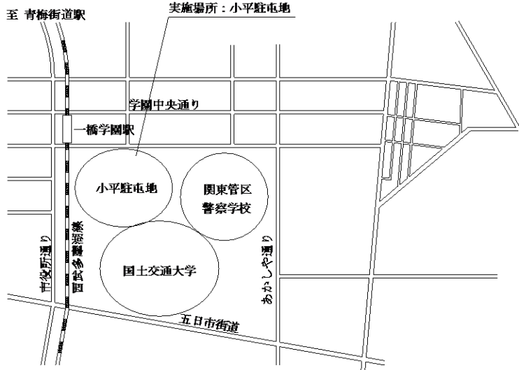
案内図 S = 1 : X