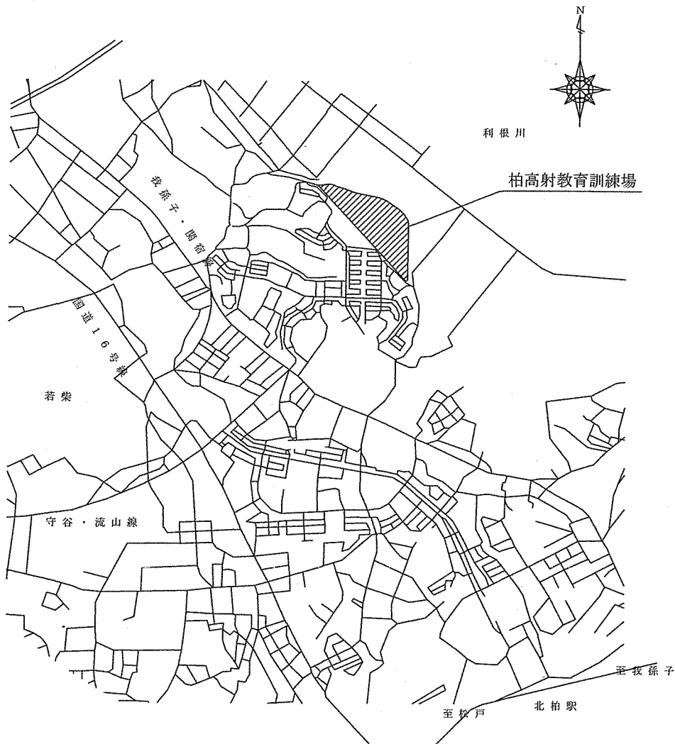
案内図 S = 1 : 40000