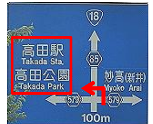
踏切通過後、高田新田交差点を左折