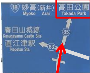
料金所通過後、直進高田公園方向へ