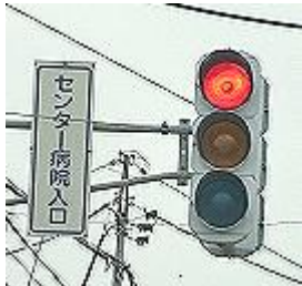
左折後、2つ目の交差点を右折