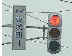
直進、直進後右手にセブンイレブンが見えたら間もなく高田駐屯地