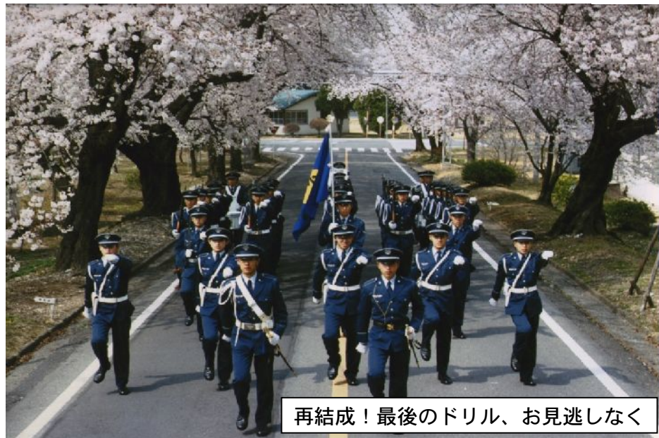
再結成！最後のドリル、お見逃しなく