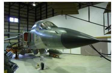
支援戦闘機「三菱F1」 （初号機）