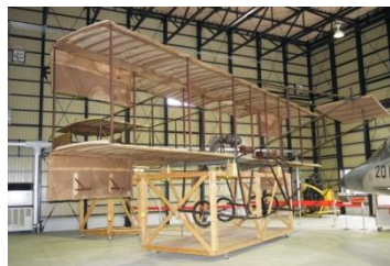
「アンリ・ファルマン機」 （我が国初の動力飛行機）