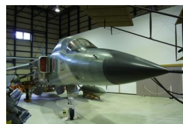
支援戦闘機「三菱F 1」 （初号機）