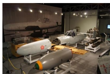
旧海軍特殊攻撃機「桜花」 （日本で唯一の実機）

詳細については、航空自衛隊入間基地ホームページの「修武台記念館について」をご覧ください。